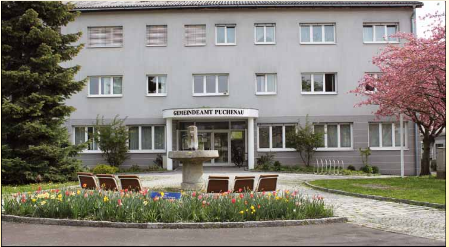
Frühling vor dem Gemeindeamt

Newsletter der Gemeinde Puchenuau - GT Mai 2018