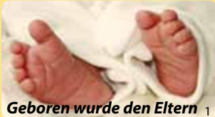
Geboren wurde den Eltern 1