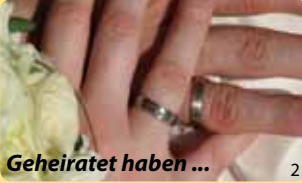
Geheiratet haben ... 2