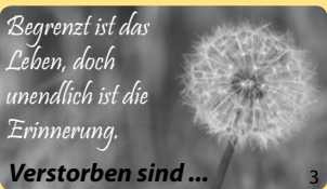
Verstorben sind ... 3