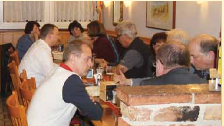
Netzwerktreffen der Puchener Vereine und Organisationen am 13. März 2018