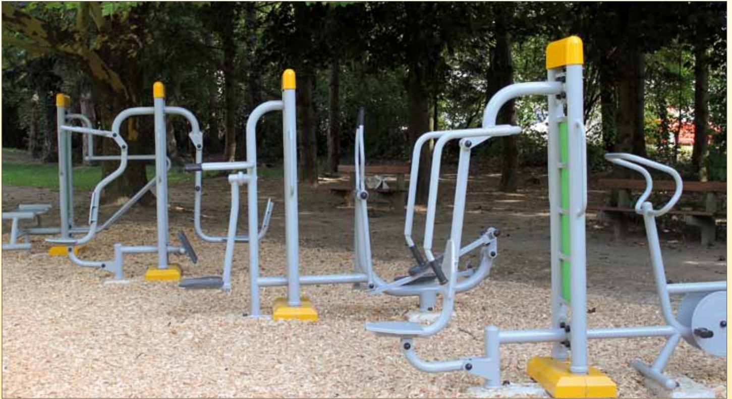
Der neue Aktivpark Puchenau - Generationen in Bewegung

Newsletter der Gemeinde Puchenau - GT Oktober 2018