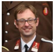
GrpKdt TLF HBM Endt Christian